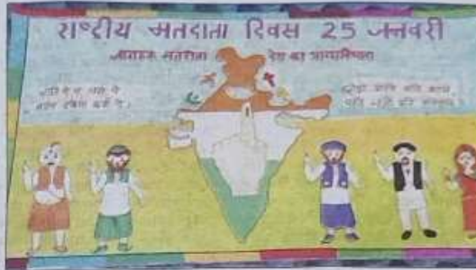
A beautiful poster made by a student during poster competition.

The students participated in the essay writing competition and expressed their opinions on the topic 'Election: Our Right and Responsibility'. Then, they also participated in the slogan and