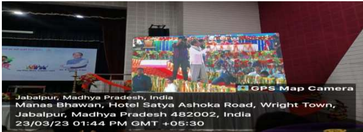
Photo of event